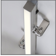
System HR-OPTI Ref: C1844 (HR- OPTI) + 42121