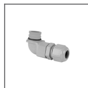
Eckige M16 x 1,5 - L90 Ref: 42289