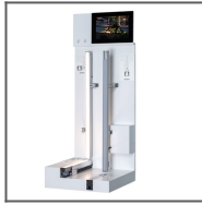
Tafel P230-90223M Ref: 90223M