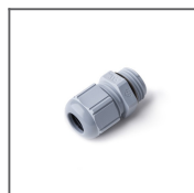
Kabelverschraubung M16 x 1,5 Ref: 42271