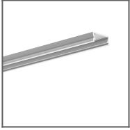
Profil TAMI Ref: B5390