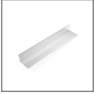
Montageeinsatz 20x33 Ref: 70459