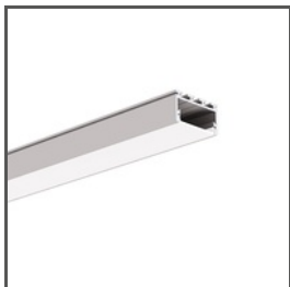
GIZA-LL A00758 Ref. arch C0758