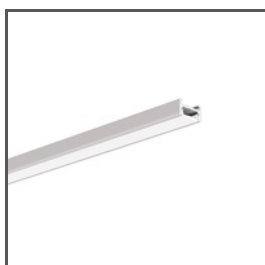
MICRO-H A00599 Ref. arch C0599