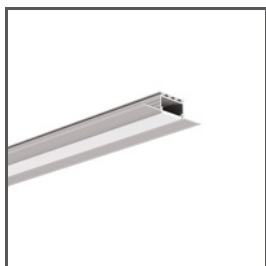
KOZUS A07823 Ref. arch B7823