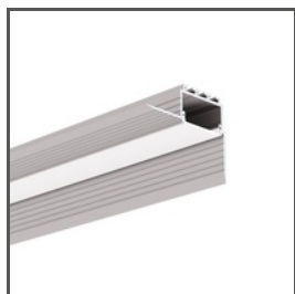
KOZUS-CR A00600 Ref. arch C0600