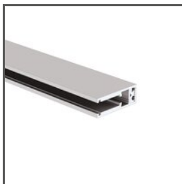
KRAV-56 A18017AZM Ref. arch 18017