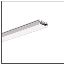
GIZA A05556 Ref. arch B5556