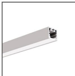
PDS-ZM-PLUS A02056 Ref. arch C2056