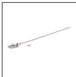
SICHERUNGSLEITUNG ZM-2 Z70521 Ref. arch 70521