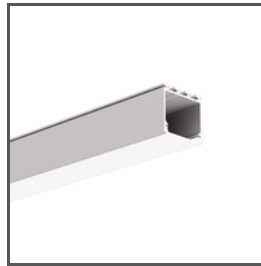
LIPOD A05554 Ref. arch B5554