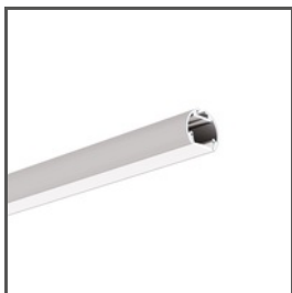
OLEK A08505 Ref. arch B8505