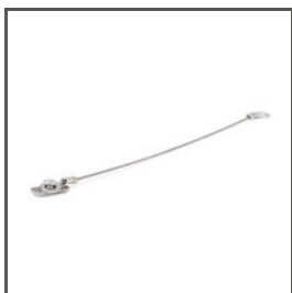
SICHERUNGSLEITUNG ZM-1 Z70520 Ref. arch 70520