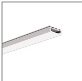
GIZA A05556 Ref. arch B5556