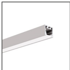
PDS-ZM-PLUS A02056 Ref. arch C2056