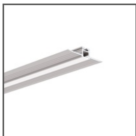
KOZEL-10 A01575 Ref. arch C1575