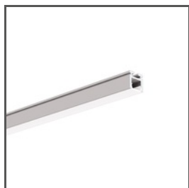
PIKO-ZM A01168 Ref. arch C1168