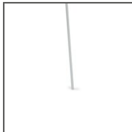
STAB FI-3-ALU C28196A01, C28196A07 Ref. arch 42526, 42527, 42528, 42529