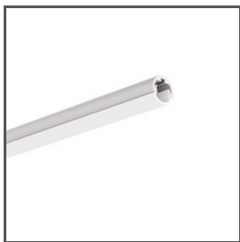
PIKO-O A01167 Ref. arch C1167